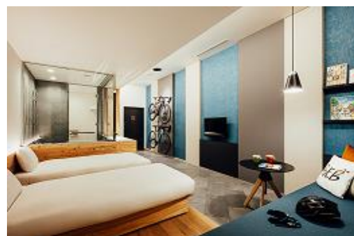
<3・4・5F CYCLING HOTEL>

居酒屋以上、旅未満。ハマル輪泊が合言葉のルーズなホテル「星野リゾート BEB5 土浦」。