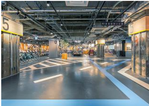
<B1・1F BIKE BASE/りんりんスクエア土浦>