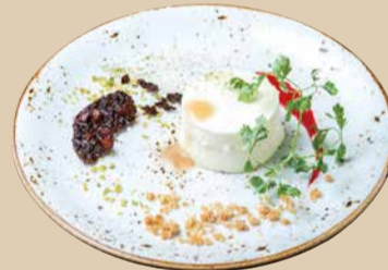
450 [税込490] Panna Cotta パナコッタ