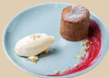
フォンダンショコラ バニラアイス添え Chocolate Fondant with Vanilla 620 [税込680]

焼きたてのフォンダンショコラの中から チョコがとろ～り バニラアイスと一緒にどうぞ!