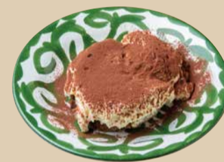
ティラミス Tiramisu 600 [税込660]

濃厚なマスカルポーネチーズと コーヒーのエスプレッソが絶妙な イタリア定番のデザート