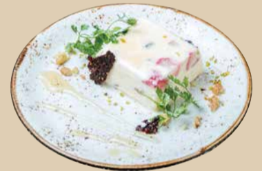
セミフレッド Semifreddo 500 [税込550]

濃厚なマスカルポーネチーズと コーヒーのエスプレッソが絶妙な イタリア定番のデザート