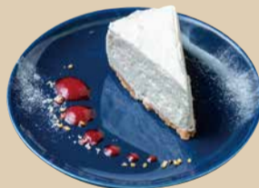
レアチーズケーキ No-Bake Cheese Cake 530 [税込580]

焼きたてのフォンダンショコラの中から チョコがとろ～り バニラアイスと一緒にどうぞ!